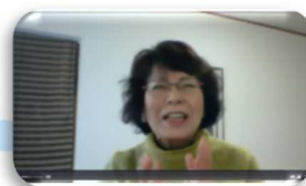
静岡会長： 朝から緊張しています！