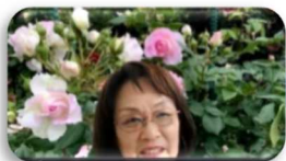
本日の司会者です。