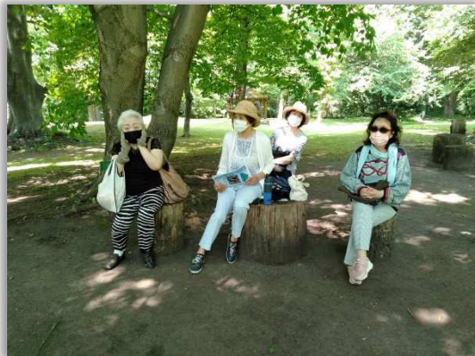
すてきな椅子でちょっと休憩！