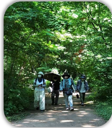
園内を颯爽と歩く4人組