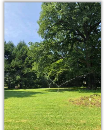
自動水まき機。木々も生き返る！