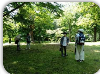
この木は何だろうね？