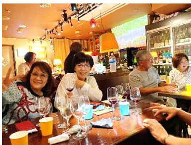
ボックス席とカウンター席に座って盛り上がっているところです。