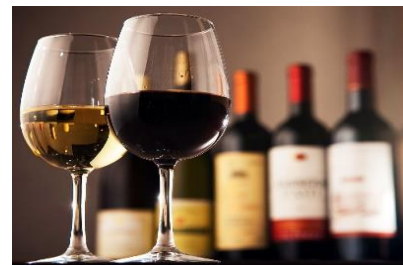
当日、みんなのお腹に入ったワイン 6本（スパークリング・白3本・赤2本） よく飲んだよね～～