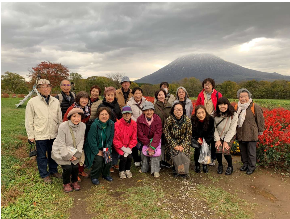
参加者一同、羊蹄山を背景に

当日の行程のメインは半月湖散策でしたが 長雨で足元の悪さが予想され残念ながら断念しました。そして、道の駅ニセコピュープラザで美味しい野菜など入手し 帰路につきました。当日は降雨の予想でしたが皆さんの心がけが良いようで、雨にもあたらず 楽しい一日を過ごすことができました。