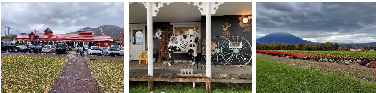
高橋牧場は酪農家でありながら生産者の顔が見えるレストラン・乳製品加工・販売など多彩な経営能力の持ち主とお見受けしました。「ミルクランド北海道」に大きな花を咲かせようと感じました。