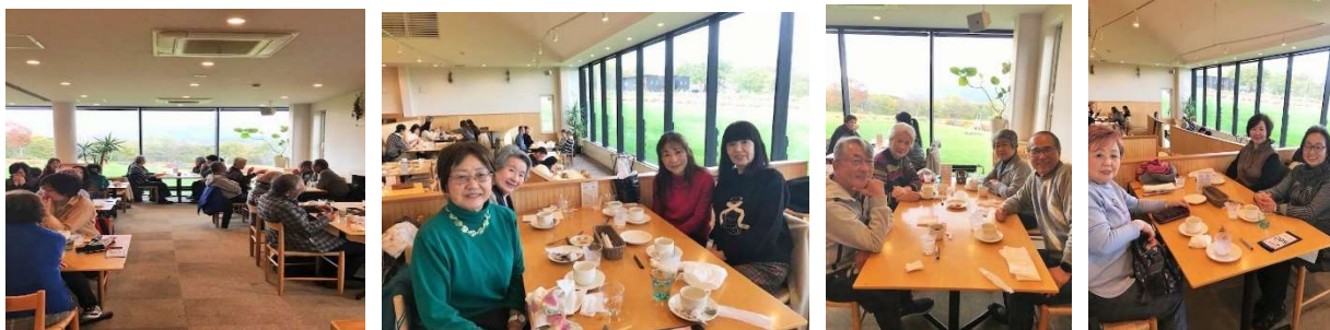
歓談しながら賑やかに食事を楽しみました